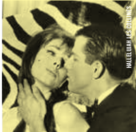
HALLELUJAH LES COLLINES