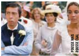
POUSSE MAIS POUSSE ÉGAL