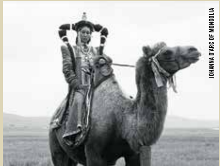
JOHANNA D'ARC OF MONGOLIA

· DU 19 AU 29 MARS · La Cinémathèque québécoise participe à la présentation de trois événements majeurs avec le FIFA. Une surprenante installation vidéo de Nathalie Bujold, un hommage à la cinéaste allemande Ulrike Ottinger , sans oublier de nombreux événements orbitant autour d'un colloque universitaire intitulé Une télévision allumée : les arts dans le noir et blanc du tube cathodique .