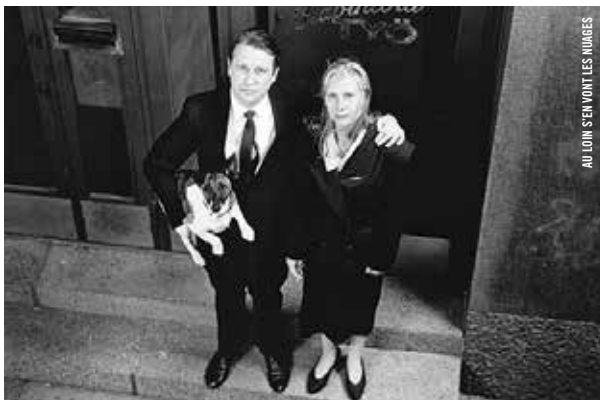
AU LOIN S'EN VONT LES NUAGES