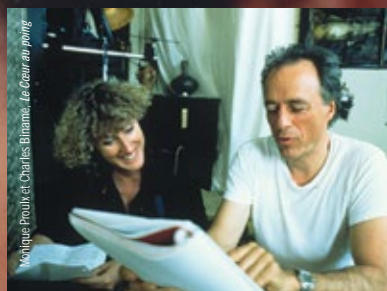
Monique Proulx et Charles Binamé, Le Coeur au poing

· DU 21 SEPTEMBRE AU 2 OCTOBRE · Concepteur visuel autant que metteur en scène accompli, Charles Binamé a souvent assumé des projets immenses autant qu'il a su créer des œuvres personnelles de plus petite échelle. Cet événement reviendra sur cette filmographie que l'on croit connaître mais dont plusieurs recoins restent encore méconnus, touchant au film expérimental, à la vidéo, au film sur l'art ou au film publicitaire, à la série télévisée autant qu'au long métrage narratif.