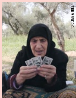
TO CLIMBA TREE