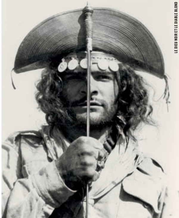
LE DIEU NOIR ET LE DIABLE BLOND