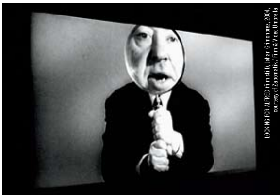
LOOKING FOR ALFRED (film still) Johan Grimoprez 2004, courtesy of Zapomatik / Film & Vidéo Umbrella