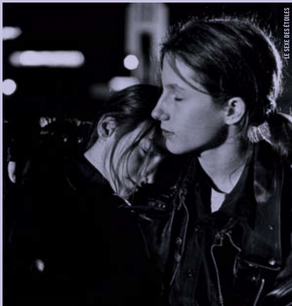
LE SERIE DES ÉTOILES